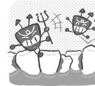
歯並びがでこぼこ